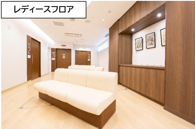
レディースフロア