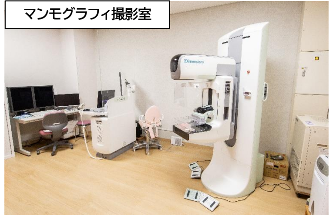
マンモグラフィ撮影室